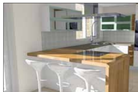
Project by Cadez - Holland

ARC+ 2011 is een winnende oplossing, gemakkelijk in het gebruik en met snelle resultaten.