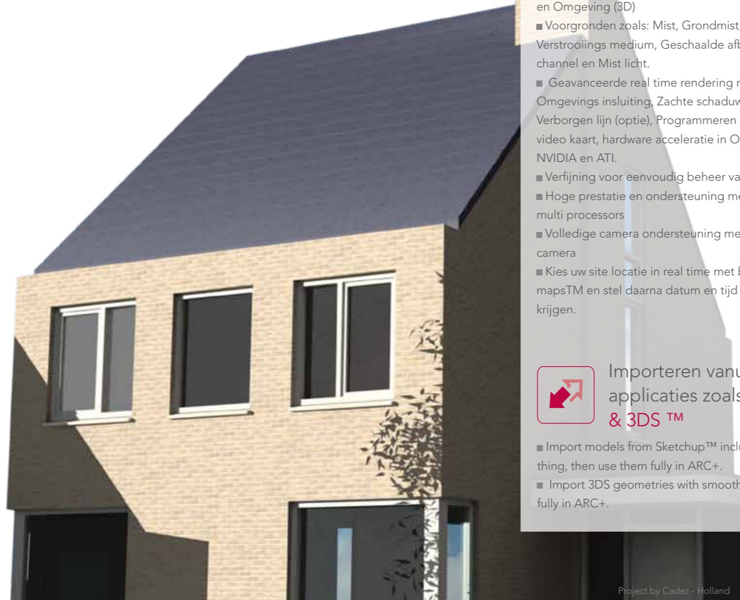
Project by Cadez - Holland